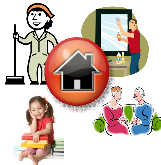
TABLA SALARIAL EMPLEAD@S DE HOGAR 2012